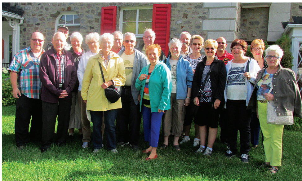
Au retour du voyage Côte-Nord, Labrador, nous avons passé la dernière nuit à l'Hôtel Le Manoir de Baie-Comeau, un 4 étoiles, très chaleureux et accueillant.

Au début du mois d'août, une vingtaine de nos membres participent au voyage Côte-Nord/Labrador. L'enthousiasme de nos participants dès le départ à l'aube de ce voyage de 7 jours démontrent l'intérêt pour cet itinéraire inusité. Nous avons rejoint un autre groupe à Donnacona pour compléter le nôtre. Notre guide et notre chauffeur ont démontré dès le départ un professionnalisme remarquable qui a été confirmé tout au long du voyage par quelques incidents. Nous avons roulé en autocar 3 700 kilomètres, 8 heures de train, une heure d'autobus scolaire et une heure trente sur le traversier Les Escoumins/Trois-Pistoles. Baie Comeau, Havre-St-Pierre, les Îles Mingan, Sep-Îles, Fermont et son mur, Labrador City, Terre-Neuve avec des paysages époustouffants, des milliers de lacs, des forêts avec une faune et une flore différentes nous démontrent l'immensité du Québec. On retrouve des richesses minières, des centrales électriques et surtout des travailleurs, des gens accueillants