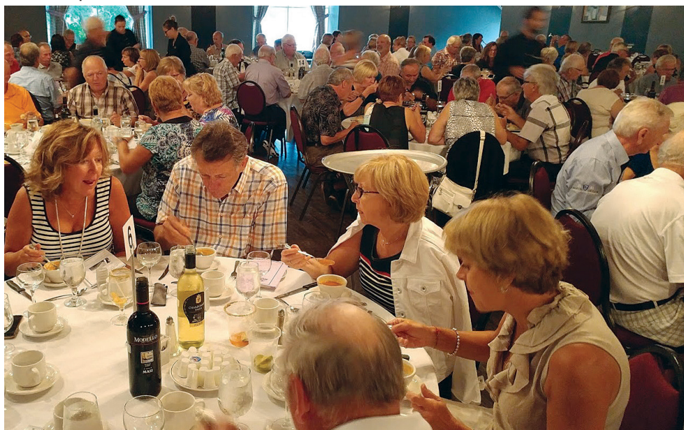
Une partie de la salle lors du souper.