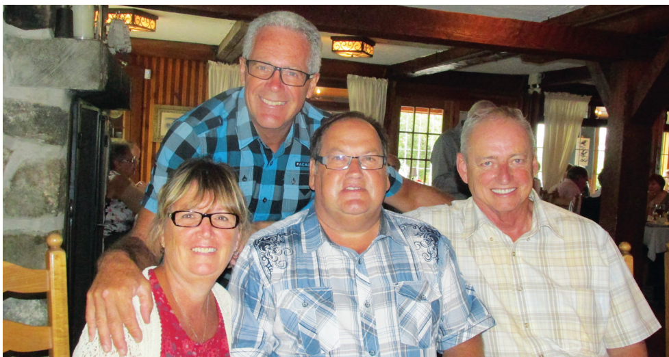
Des membres des Laurentides, toujours fidèles aux activités étaient heureux de venir retrouver des gens de la Rive-Sud.