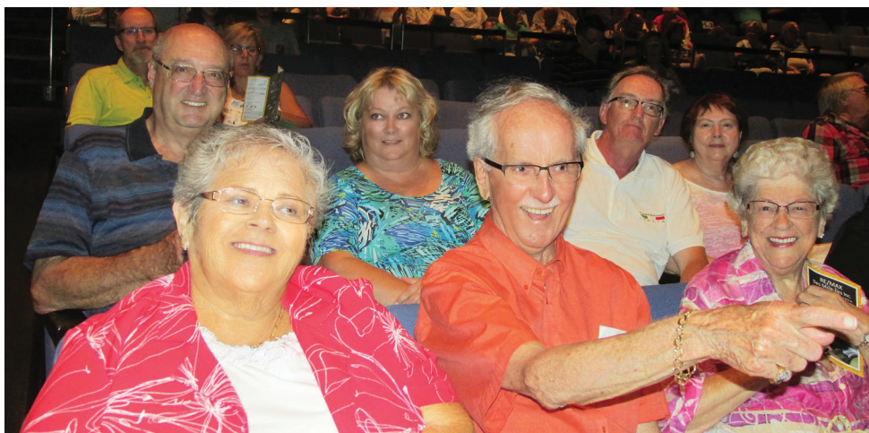
Les spectateurs en attente du lever de rideau s'amusent déjà en bonne compagnie.

Cent personnes ont répondu à l'invitation du président pour cette sortie estivale. C'était une des journées les plus chaudes du mois avec un taux d'humidité record. La climatisation absente dans les deux restos choisis a diminué le plaisir gastronomique du menu et occasionné l'inconfort des invités. Les gens ont profité de l'environnement de la place pour se