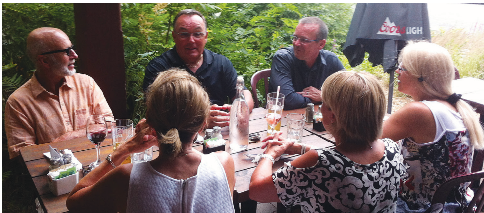
Quelques retraités ont opté pour la terrasse à la recherche d'un peu d'air frais.

regrouper et échanger avant l'ouverture du théâtre tout en prenant l'air. La pièce Drôle de couple était amusante mais sans plus à cause des longueurs de la première partie. Un spectacle d'été ne comble pas toujours les attentes engendrées par la publicité. Cependant, cette sortie en bonne compagnie a été très appréciée pour le rapport qualité-prix et l'opportunité de se rencontrer en juillet. D'autres occasions se présenteront et nous comptons sur votre présence. ⌘