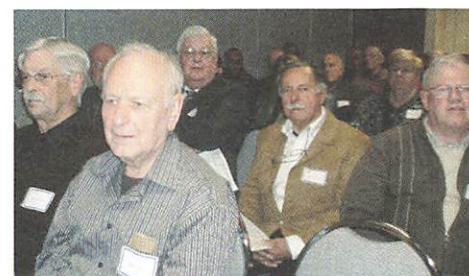
Un auditoire attentif lors de déroulement de la réunion

Il a mentionné ensuite que les secteurs éloignés bénéficiaient de budgets afin d'organiser des activités locales tout au long de l'année, tels que dîners, sorties à la cabane à sucre, tournois de golf, etc.