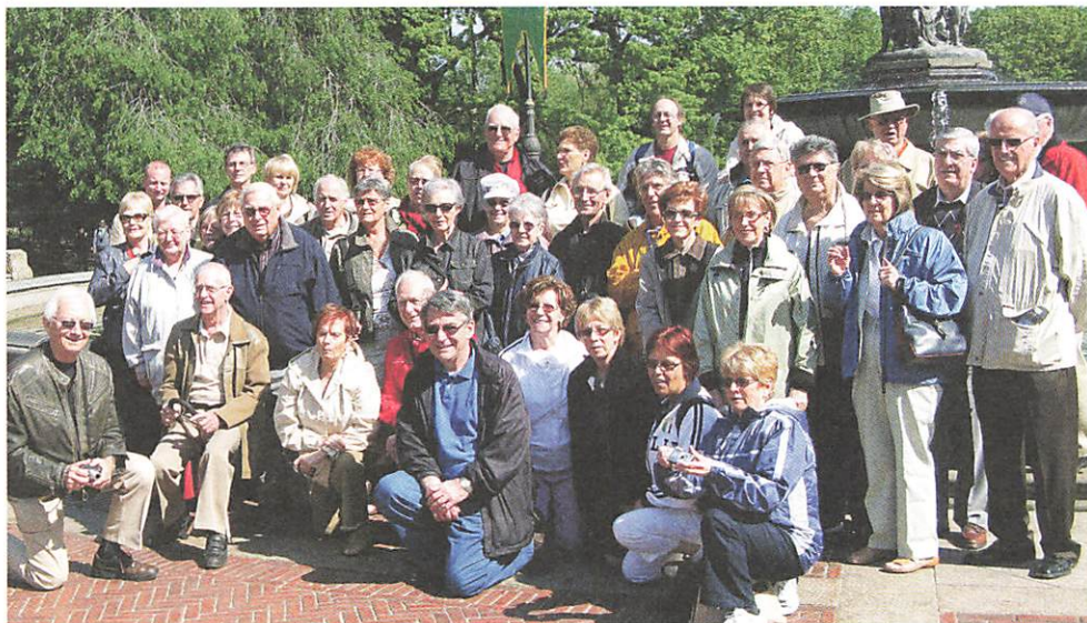
Les joyeux voyageurs profitent d'une belle ballade dans Central Park.

P lusieurs de nos retraités rêvaient d'un séjour à New York mais n'osaient pas s'y aventurer avec leur voiture. Nous sommes donc partis en autocar de luxe au petit matin pour une escapade de quatre jours intitulée la grosse pomme en 4, le 11 mai dernier.