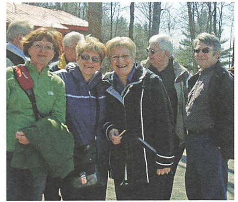
Les retraités présents ont profité de la magnifique température

Sans compter les calories, on passait ensuite à l'extérieur pour déguster la tire sur la neige. Profitant de cette première belle journée, nos invités ont choisi le petit train pour faire une balade dans le boisé et d'autres pour se balancer comme de jeunes étudiants. Le chaud soleil bronzait nos visages pâles tout en poursuivant les conver-