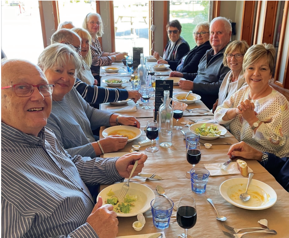
Une visite dans le vignoble Kobloth & Fils au mois d'octobre a charmé les 49 membres qui étaient présents cette journée-là. L'activité fut appréciée de tous.