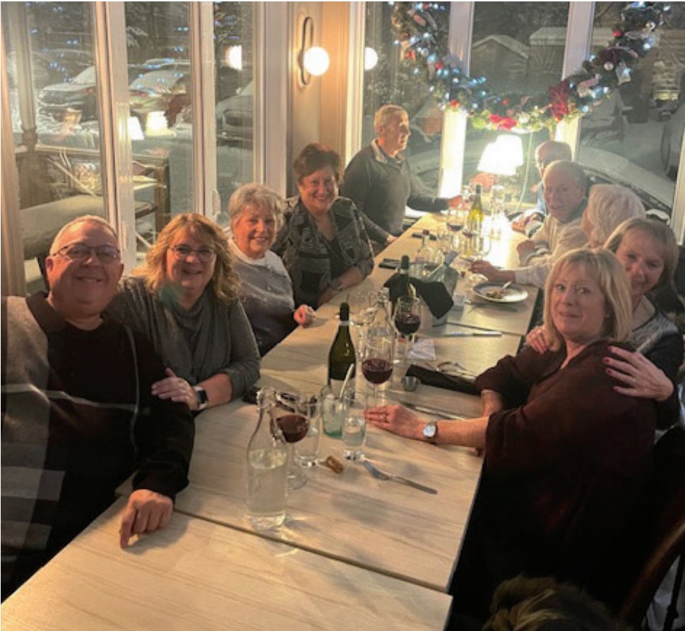
Nous avons eu un excellent souper au Restaurant Bistro Louis XIV à St-Bruno le 10 décembre dernier. Les 75 membres du secteur ont passé une belle soirée ensemble dans une ambiance chaleureuse.