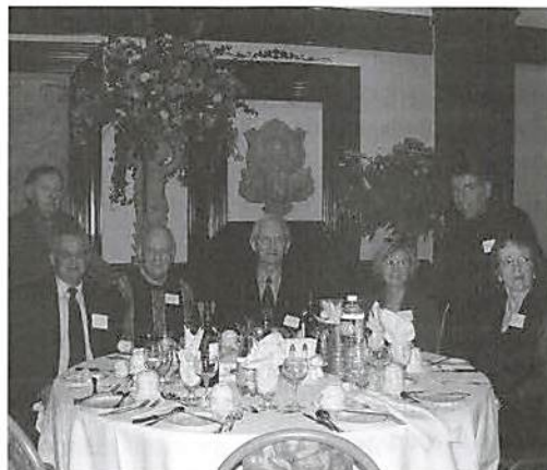
Souvenir du déjeuner annuel 2003 représentant le conseil d'administration

qui se tiendra le 26 octobre prochain à la salle de réception LE RIZZ, situé au 6630, rue Jarry est, à Montréal. Pour cette activité annuelle, vous aurez le loisir de rencontrer vos amis(es), de déguster un repas délicieux et de vous délasser les jambes au son de la musique de l'orchestre